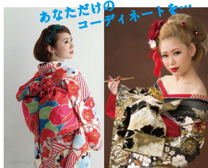
吉井スタジオ衣装部門「HANAかんざし」

ヘアメイクから着付け・前写しまでトータルコーディネート致します♪着物レンタル・購入から小物だけのレンタルもOK! レンタルは、40,000円~(税抜)。 まずはお気軽にお問い合わせ下さい。