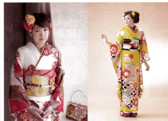
吉井スタジオ衣装部門「HANAかんざし」